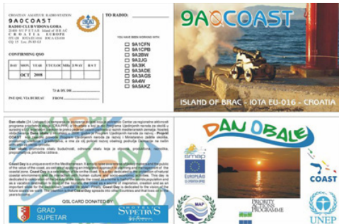
Carte postale du Jour de la Côte

L'événement central du 24 octobre a été l'atelier « Nos côtes : ce que nous pouvons faire pour eux », qui a eu lieu à l'école internationale de Pafos ( http://www.isoped.org/index.html ) sous la coordination d'AKTI et avec la participation et l'assurance des médias.