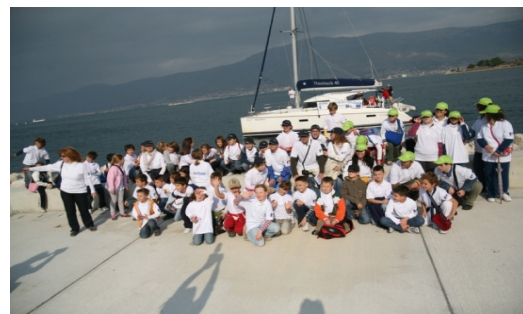
Concours de voile en Croatie

Par ailleurs, l'équipe de navigation qui a représenté la Croatie durant les Jeux Olympiques de Pékin, ont été nommés ambassadeurs croates pour la côte pour l'année 2008/2009. Ils ont été choisis comme représentants d'un sport qui respecte la conscience environnementale, mais également en raison de leurs gestes et solidarité démontrés pendant les Jeux Olympiques à Pékin.