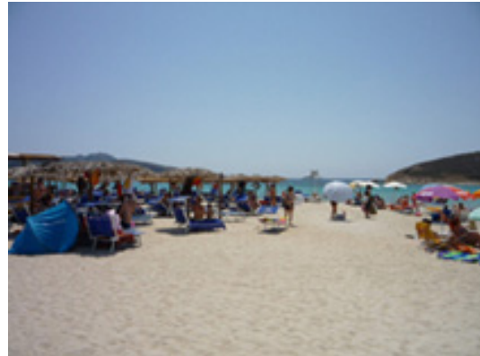
Plage en Sardaigne

être jusqu'à 50% du littoral qui serait construit d'ici à 2025 contre 40% en 2000. Dans ce contexte, la Gestion Intégrée des Zones Côtières (GIZC) et le protocole récemment adopté sont les « outils » les plus performants pour garantir un développement durable de la côte dans la mesure où ils proposent un moyen efficace de garantir que les actions humaines prennent en considération la nécessité de trouver un équilibre entre les priorités et les objectifs économiques, sociaux et environnementaux dans une perspective à long terme.