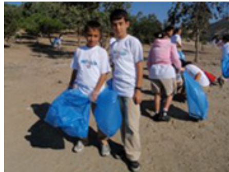
Les enfants nettoient la plage en Turquie

Côte à rejoindre l'action commune pour améliorer la gestion de plages à l'échelle nationale et régionale. Par conséquent, les activités de nettoyage de plages ont été organisées en Algérie, Chypre, Jordanie, Italie, Maroc, Tunisie et Turquie.