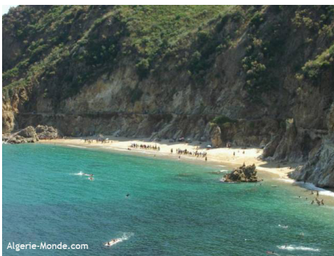
Plage en Algérie

Le Jour de la Côte en Algérie a été célébré dans le parc national d'el Kala, sous l'organisation du Ministère de l'Agriculture et les ONG locales. Le programme a inclus une ouverture médiatique, publication du communiqué de presse dans les journaux nationaux, exposition des affiches, conférence de presse, et transmission sur les chaînes radio locales. Le Jour de la Côte a aussi été célébré par les enfants et les étudiants, qui ont participé dans l'action de nettoyage des plages, concours de photo, concours de volley de plage et une excursion de pêche.