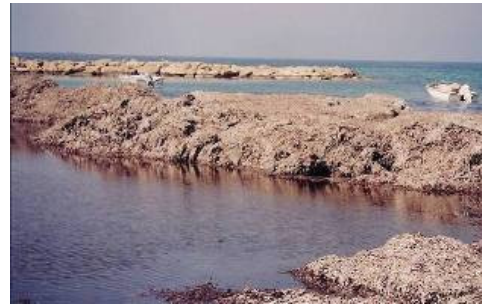
Plage en Chypre

En Chypre trois médias ont favorisé la promotion du Jour de la Côte durant tout le mois d'octobre: le journal hebdomadaire ADESMEVTOS éditera et publiera les articles appropriés préparés par AKTI chaque semaine. La radio « Cosmos » a inclus dans son programme le sujet de Jour de la Côte avec les messages courts se rapportant à la plage et à la gestion côtière, ainsi que à la nécessité de protéger nos côtes du futur.