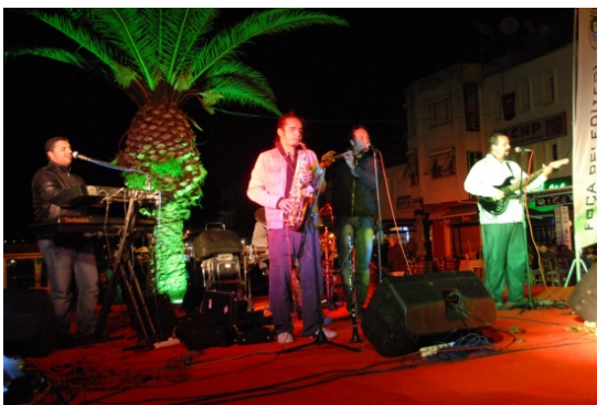
Concert en Turquie

Dans le futur l'objectif est d'organiser diverses activités pendant les mois d'été dans plusieurs municipalités dans cette initiative importante et de présenter tous les résultats durant la cérémonie centrale le 24 Octobre. Les activités, documents et photos sur le Jour de la Côte en Turquie sont disponibles sur le site web du Ministère de l'Environnement www.cevreorman.gov.tr .