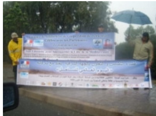
La célébration du Jour de la Côte à Oujda, Maroc

http://www.youtube.com/watch?v=3cVi0_zBs-k , et le communiqué de presse sur le Jour de la Côte est disponible sur le site web de l'ESCO: http://www.oujdaesco.tk/