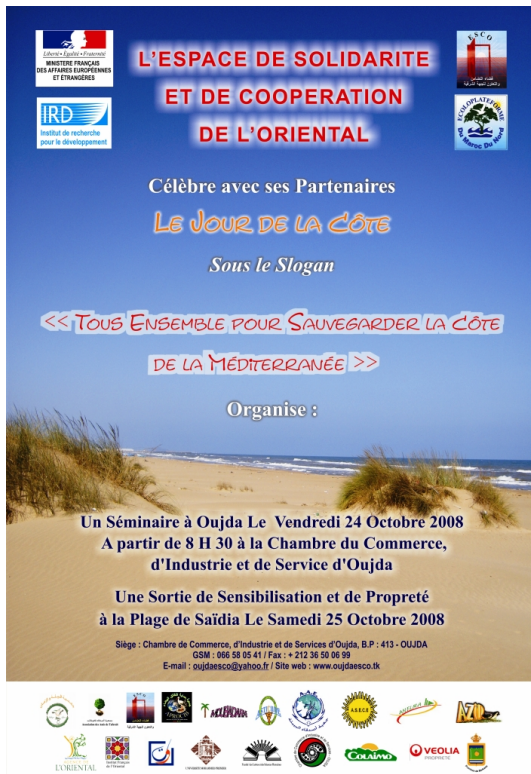
Affiche du Jour de la Côte

Le jour de la Côte a été également célébré à Nador , où l'atelier sur la future du Mar Chica a été organisé par l'ONG Forum de l'Urbanisme, Environnement et le Développement (FUED) . Le Mar Chica est la plus grande lagune de la rive sud de la Méditerranée, qui a été classée site Ramsar grâce à sa richesse écologique et biologique importante.