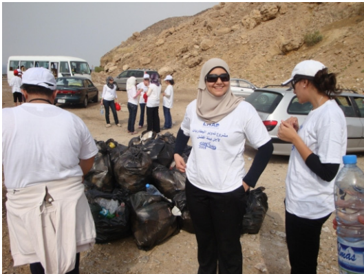
Action de nettoyage de plages en Jordanie

La campagne de nettoyage de plage a eu lieu à Maeen, sur la Mer Morte. Cet endroit est témoin de la gestion touristique insuffisante.