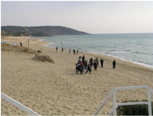
Action de nettoyage de plage en Grèce

En outre, l'Institut de recherche de pêche a organisé des activités communes avec le bureau local d'éducation environnementale de la préfecture de Kavala comprenant l'événement de nettoyage en plages de Kavala avec les écoles locales et de la diffusion des matériels promotionnels du Jour de la Côte.